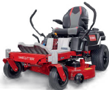
TIMECUTTER® MR 4275T MODÈLE 74690