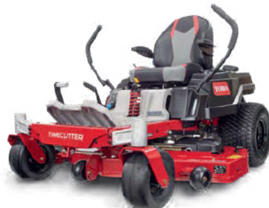
TIMECUTTER® MR5075T MODÈLE 74694