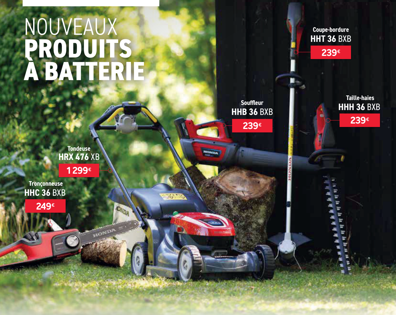
Tondeuse HRX 476 XB