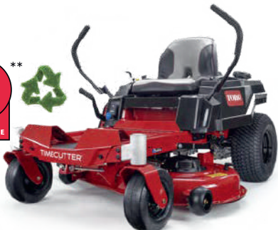
TIMECUTTER® ZS 4200S/ T MODÈLE 74683 / 74677